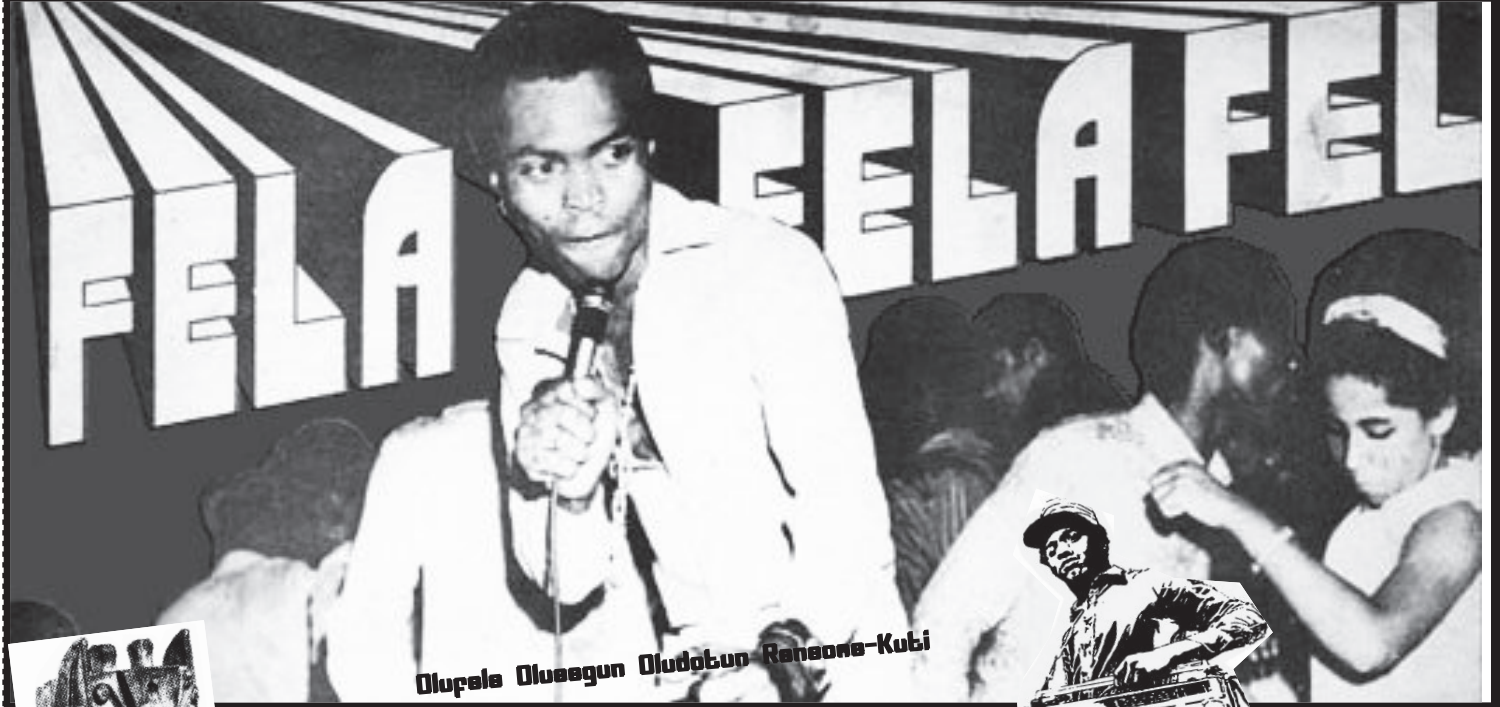
Olufela Olunogun Oludotun Ransome-Kuti